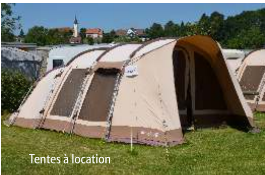
Tentes à location